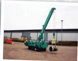
Déplacement de charge