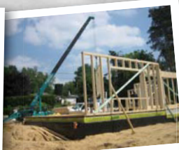
Charpentes en bois