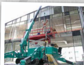
Pose de vitrages