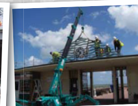
Travaux de large voiries